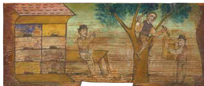
Poslikana panjska končnica, Čebelarški muzej v Radovljici

In če morda še niste vedeli za mednarodno uspešnost našega medu – slovenski med je 19. slovenski proizvod, registriran pri Evropski komisiji.