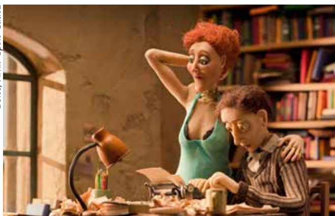
Boles, Arhiv Špele Čadež