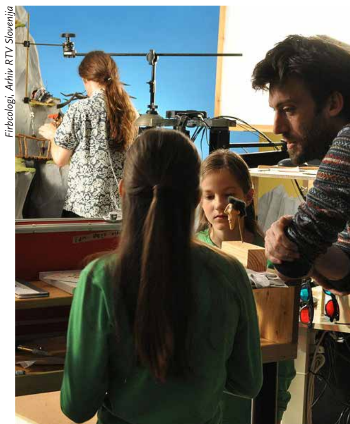
Firbcologi, Arhiv RTV Slovenija

Predstavitve bo potekala po protokolu kratkega diskurza skozi zgodovino robotske umetnosti pri nas in se nato osredotočila na konkretno razstavo ARTROBOLAB , ki je bila decembra 2013 v Kulturnem središču vesoljskih tehnologij (KSEVT) v Vitanju.